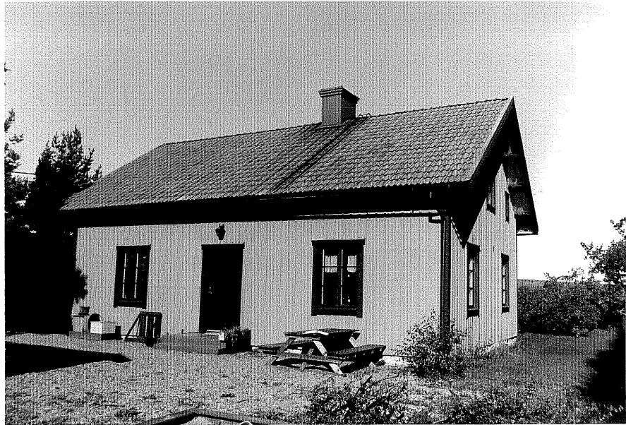
Neg.nr ÖKM 01:14 Gamla ålderdomshemmet från SO

Ödeshögs kommun Heda socken Kyrkobacken 1:5 Gamla ålderdomshemmet