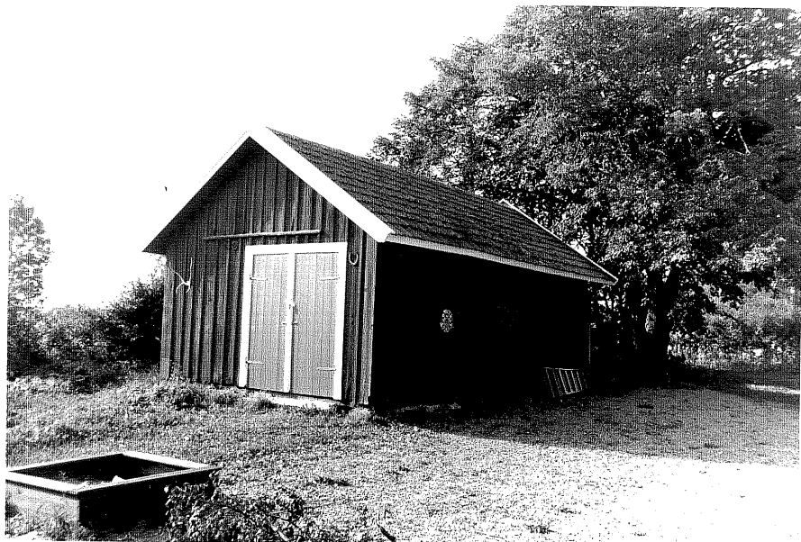
Neg.nr ÖKM 01:12 Redskapsbod från NO