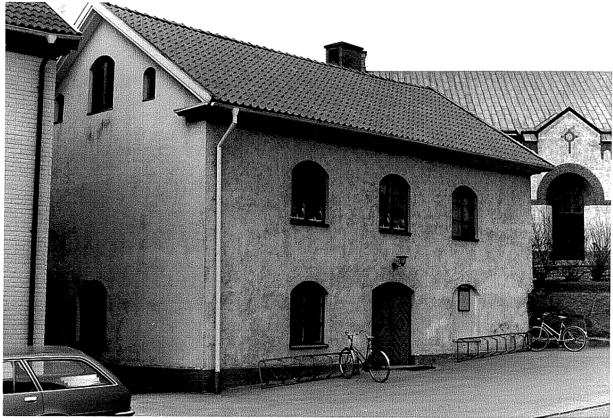
Gamla sockenstugan fr.S, 2:20.

Ödeshög sn Kyrkogården 1 1 Storgatan foto:M.Wikdahl,1978.