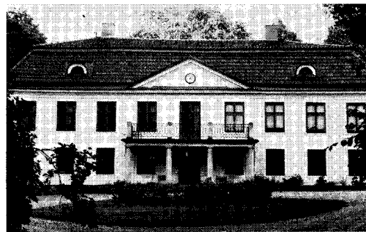
Sjöströpp har den klassiska herrgårdens vackra linjer.