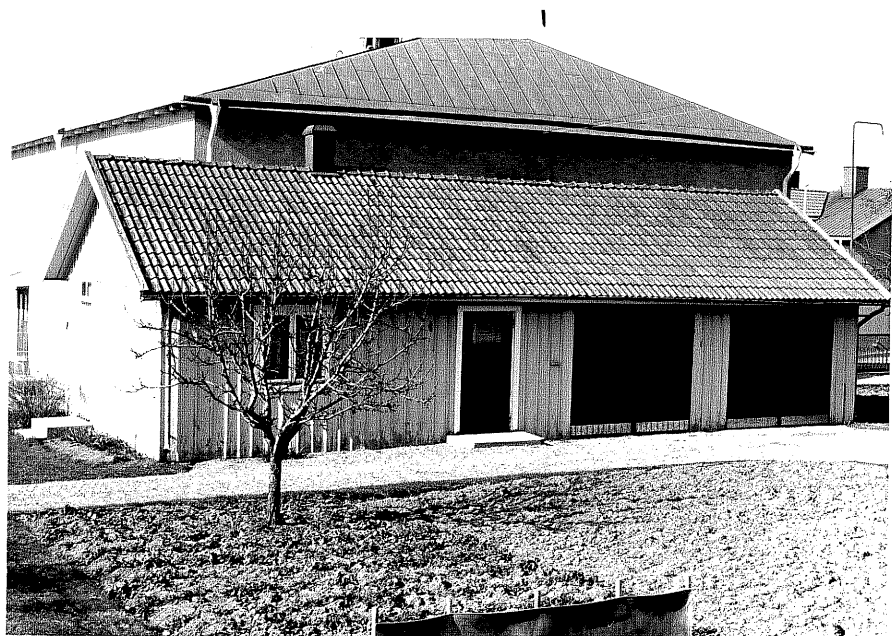
Uthus b fr.9, 11:3.