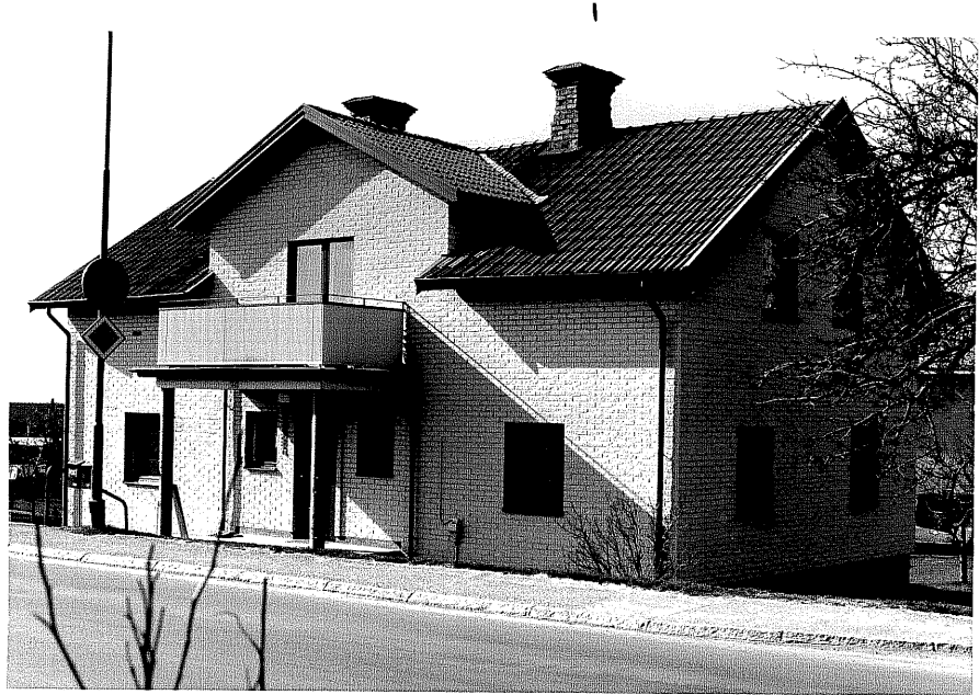
Bostadshus a fr.90, 11:4.

Ödeshög sn Liljan 3 Storgatan 32 foto:M.Wikdahl, 1978.