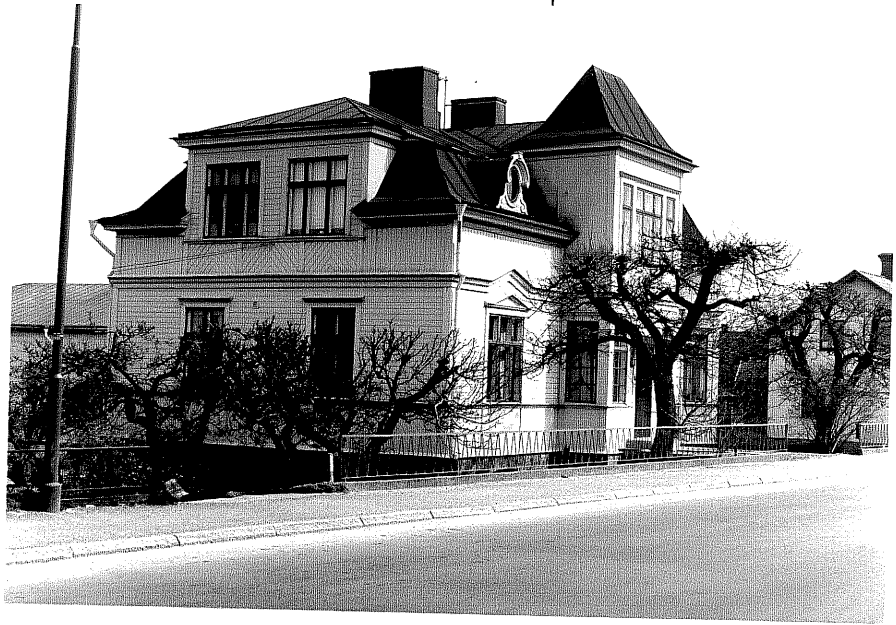
Bostadshus a fr.SV, 16:3.