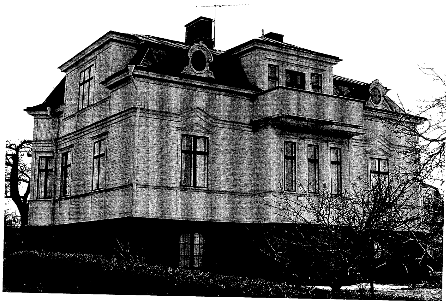
Bostadshus a fr.N, 11:6.