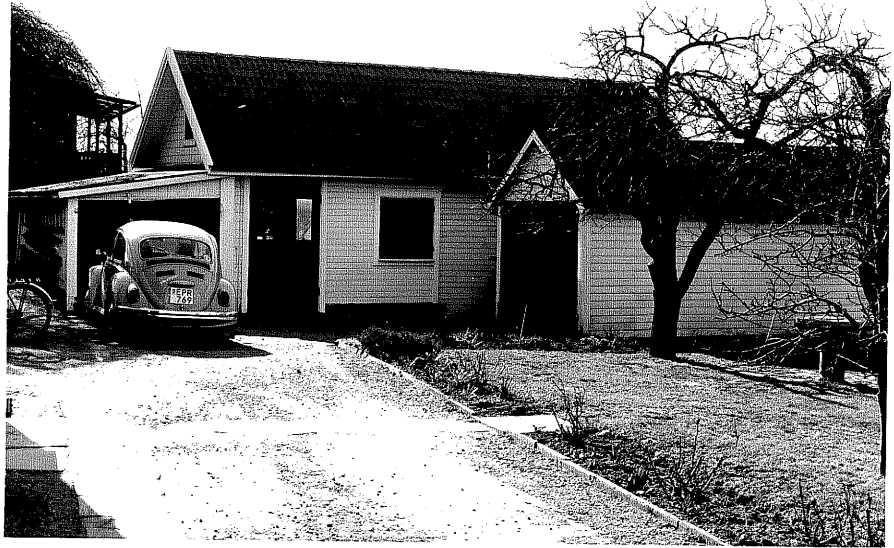
Uthus b och c fr.0, 11:5.

Ödeshög sn Liljan 4 Storgatan 34 foto:M.Wikdahl,1978.