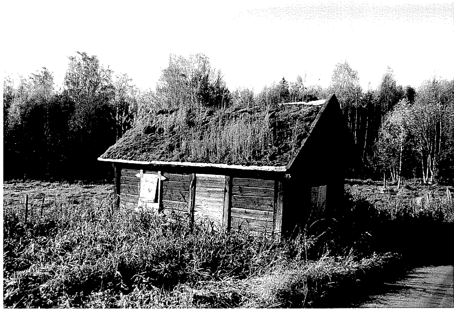
Neg. nr. T 03:16