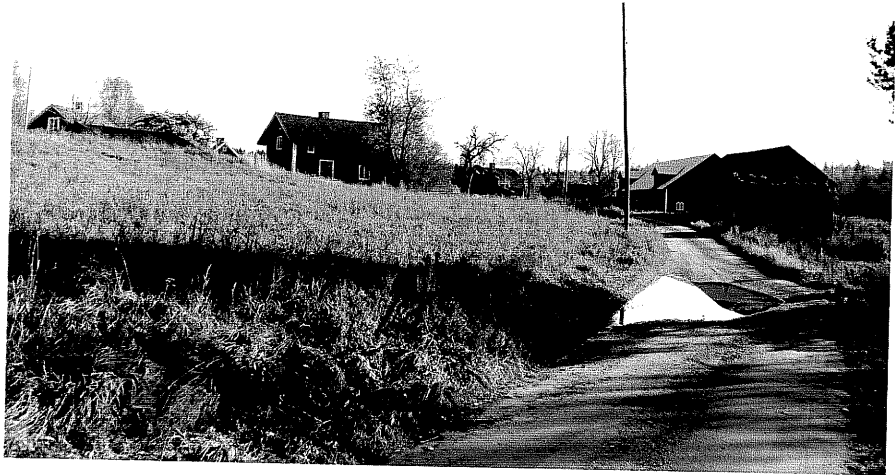
Neg. nr. T 03:19 Miljö från NV