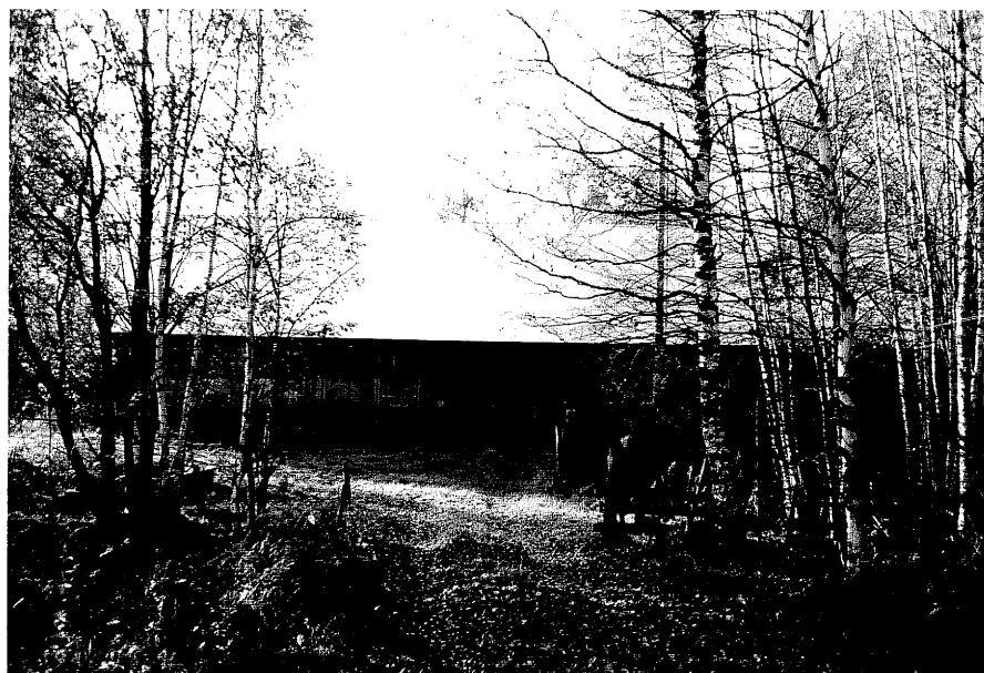
Neg. nr. T 03:17