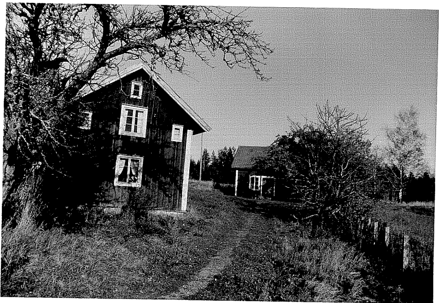
Neg. nr. T 03:21 Bostadshuset från SV