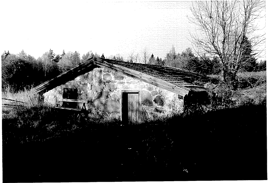
Neg. nr. T 03:22 Jordkällare från S