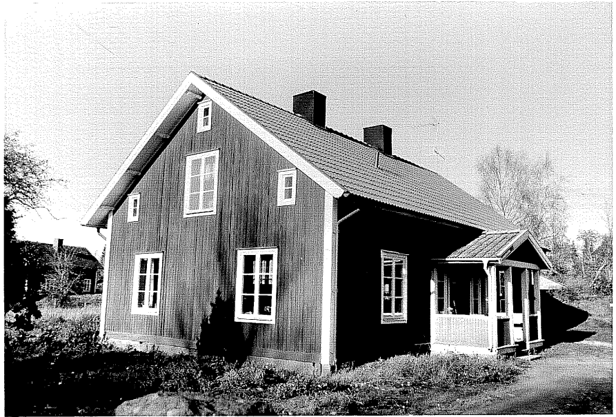
Neg. nr. T 03:01 Byggnad B från V