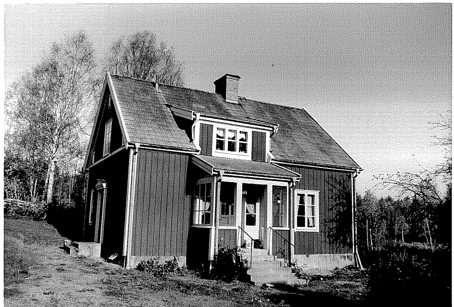
Neg. nr. T 03:11 Byggnad C från SV