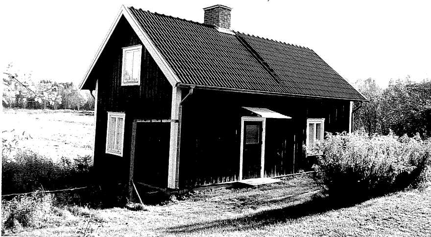
Neg. nr. T 03:07 Byggnad E från N