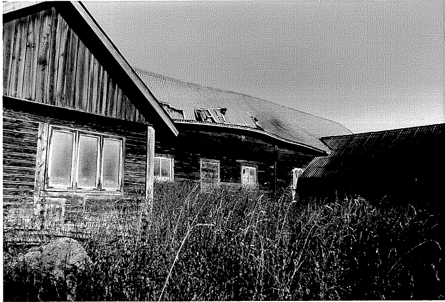
Neg. nr. T 03:04 Byggnad F från SV