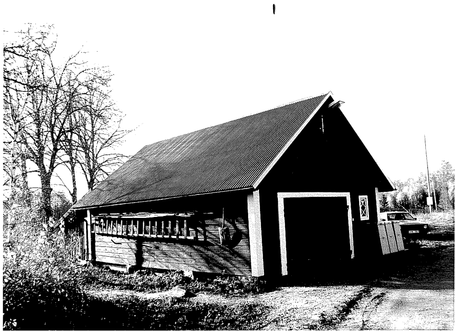
Neg. nr. T 03:06 Byggnad J från O