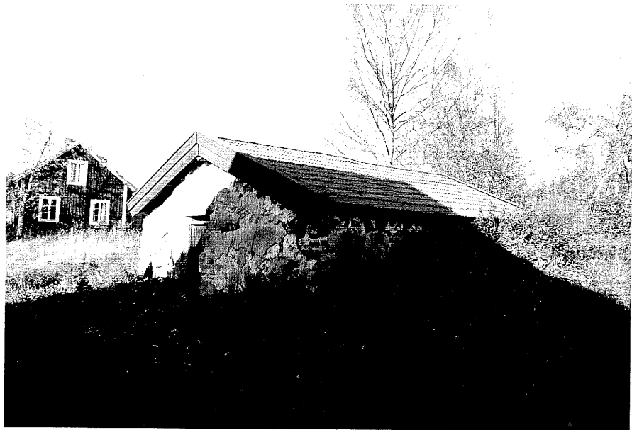
Neg. nr. T 03:12 Jordkällare (byggnad K) från S