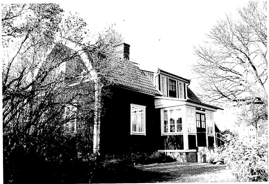
Neg. nr. T 03:08 Byggnad A från S