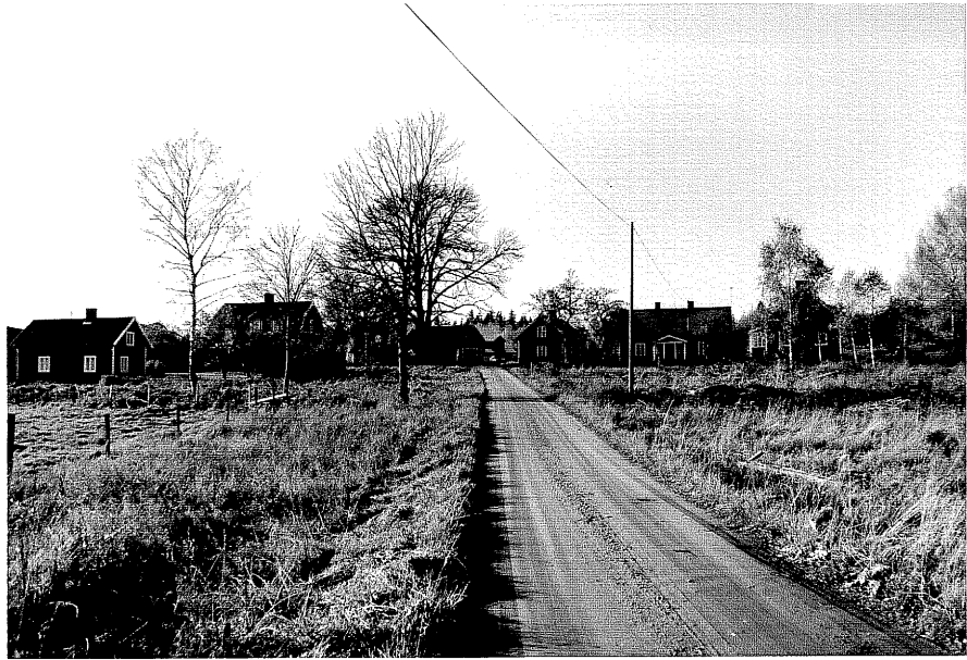
Neg. nr. T 03:23 Byn från S0