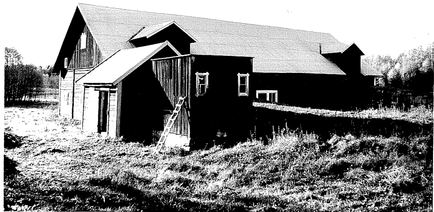
Neg. nr. T 03:14 Byggnad G från O, i förgrunden byggnad L.