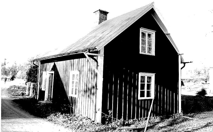
Neg. nr. T 03:09 Byggnad D från S