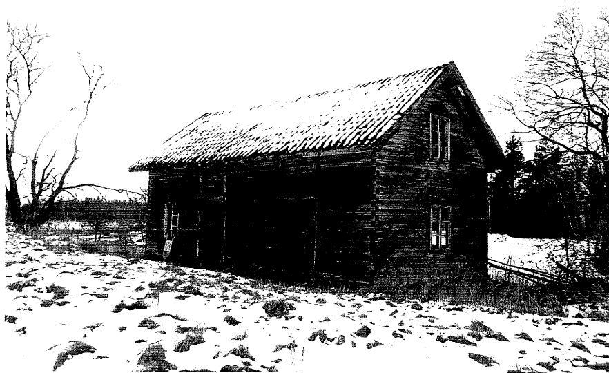
Neg. nr. T 13:20 Flygelbod från NO