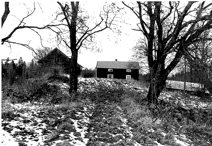
Neg. nr. T 13:18 Lillefall i miljön från S