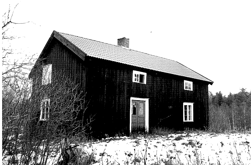
Neg. nr. T 13:19 Manbyggnaden från SV