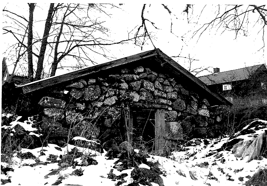
Neg. nr. T 13:21 Jordkällare från O