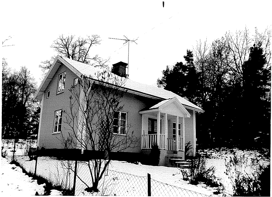
Neg. nr. T 13:22 Björkbacken från SO

Ödeshögs kommun Trehörna socken Lillefall 1:2 Björkbacken