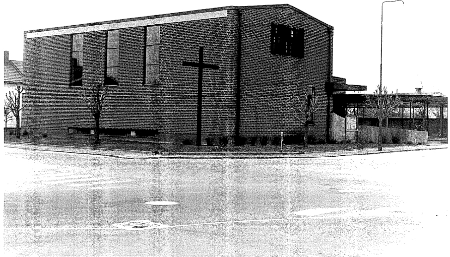
Immanuelkyrkan fr.N, 6:9.

Ödeshög sn Limhallen 1 Klubbgatan foto:M.Wikdahl,1978.