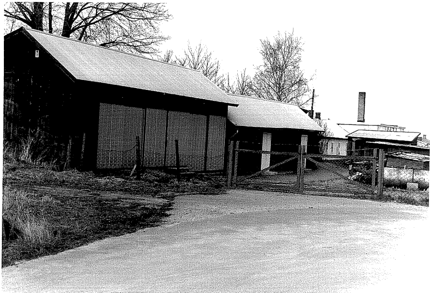
Förrådslokaler fr.0, 6:11.