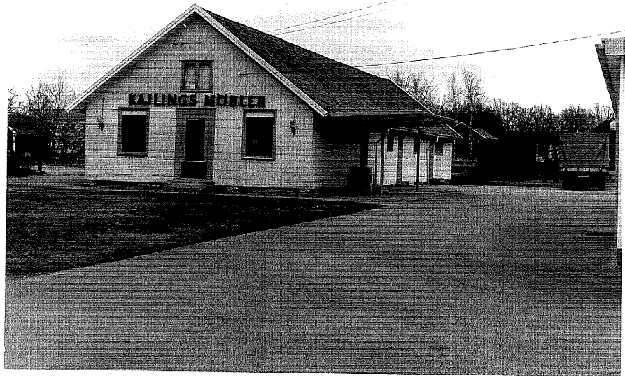
Försäljningslokal c fr.N, 2:8.

Ödeshög sn Handelsman Johanna 5, Limhallen 5 och 6. Smedjegatan 13 foto:M.Wikdahl,1978.