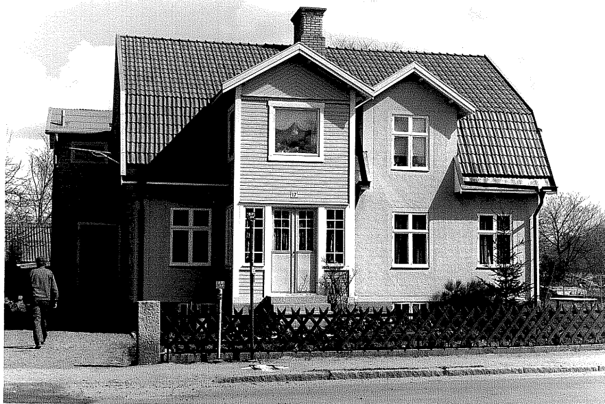
Bostadshus a fr.6V, 6:25.

Ödeshög sn Limhallen 7 och 9 Smedjegatan 17:1978.