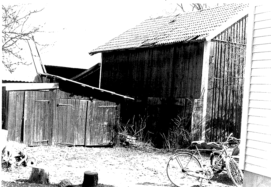
Uthus b och c fr.6V, 6:24.