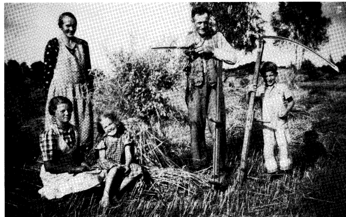
Ovan: Rågen körs in i Stenkilsby hos familjen Glad