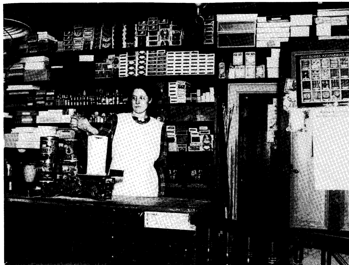
Omkring 1880 fanns tre personer antecknade som handlande i Svanshals socken. En av dem fanns i Kvarnstorps. Den här bilden från Kvarnstorps affär är dock av betydligt senare datum

Det var först mot 1800-talets slut som lanthandeln blev vanligt förekommande. Fram till mitten av århundradet hade det inte varit tillåtet att bedriva handel i fasta affärslokaler på landsbygden; det var ett privilegium förbehållet städerna.