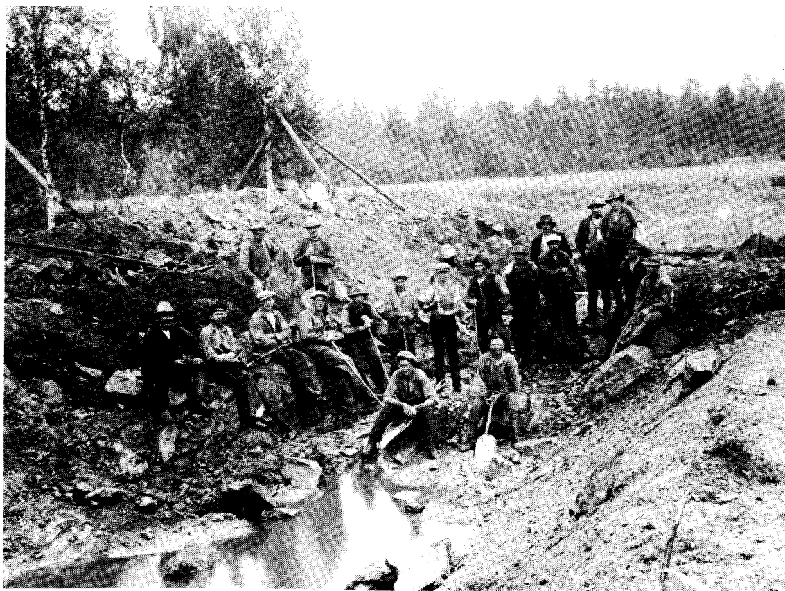
Grävning av stordike Tjurtorp—Sättra 1927

Man lånade friskt av varandra på landsbygden — också det en form av handel där lånen värderades. Även prästerna var med i lånehandeln, t ex: "1860 Lånt utaf Prost Kinnander 4 Tjog Halm väger 35 pund st".