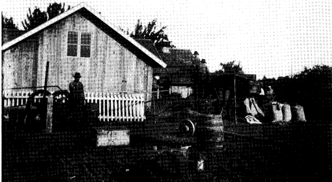
Tröskning. Henning Aronsson är maskinskötare