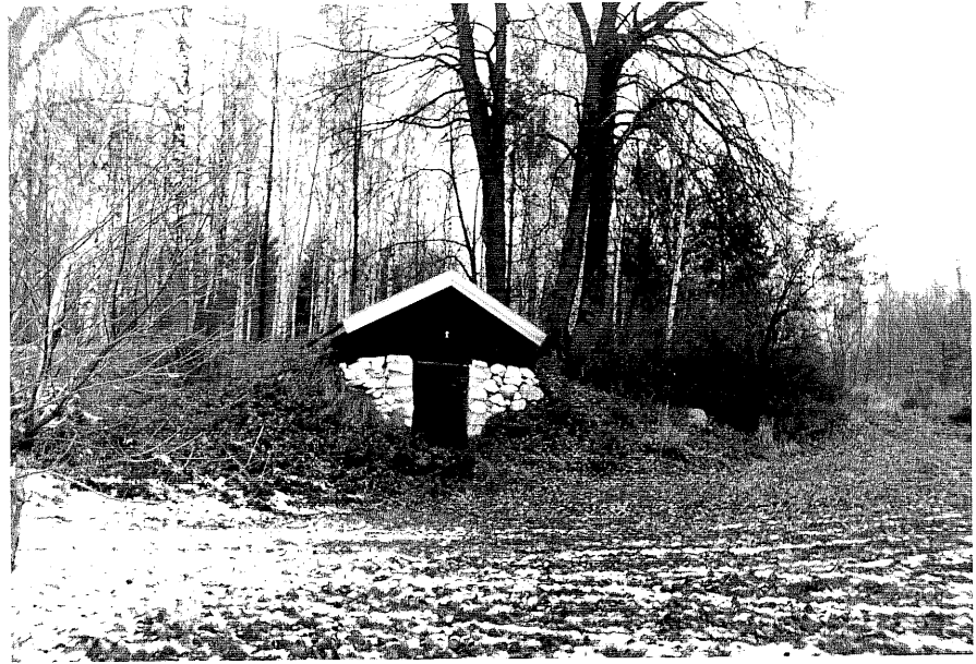
Neg. nr. T 09:08 Jordkällare från SO