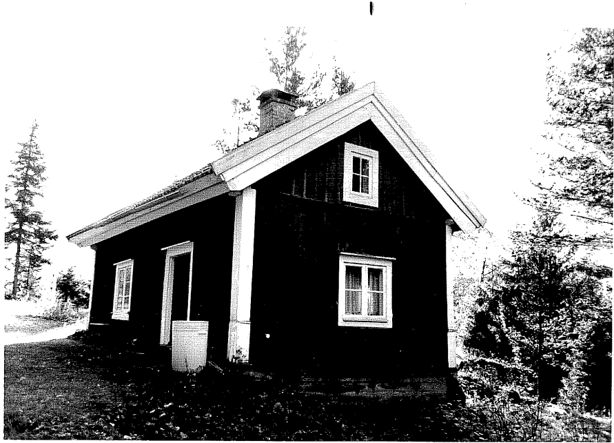
Neg. nr. T 01:02 Torpet från NO