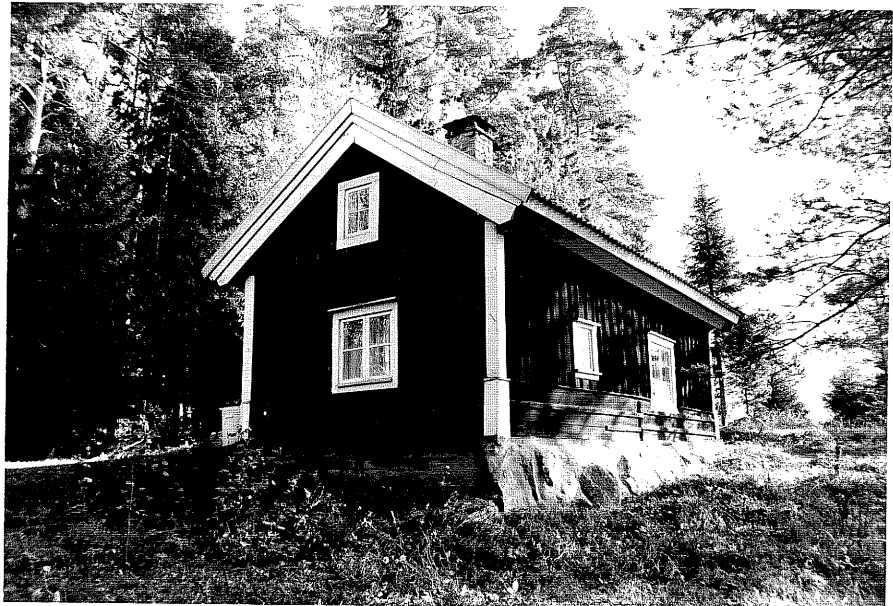
Neg. nr. T 01:03 Torpet från NV