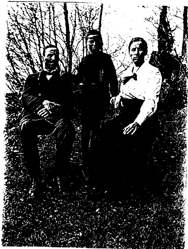
Verner med sina föräldrar.