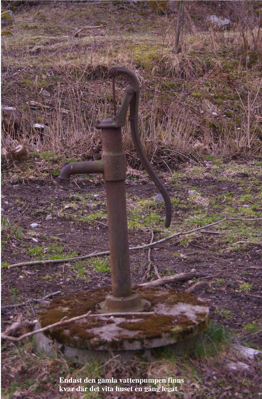
Endast den gamla vattenpumpen finns kvar där det vita huset en gång legat