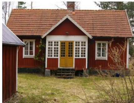
Bilden på Vilan är tagen 2013

Minnesbilderna från tiden i torpet är, som vanligt, begränsade. Jag kommer ändå ihåg att jag tyckte det var vackert där på våren. Torpet låg precis i skogskanten och omgärdades både av skog och av öppen mark. Det som jag särskilt kommer ihåg, eftersom vi kom dit på våren, var alla vitsippor.