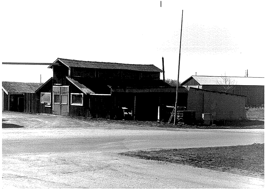
Verkstadsanläggning fr. SO,3:12.