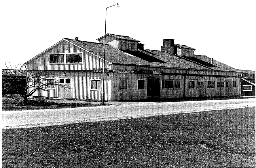
Fabriksbyggnad a fr. SO,3:13.