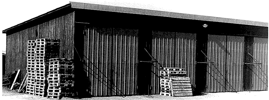
Förrådsskjul a fr. SV,3:15.