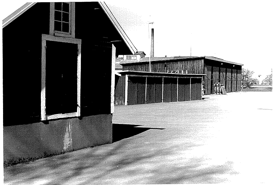
Uthus b och d fr. SV,3:17.