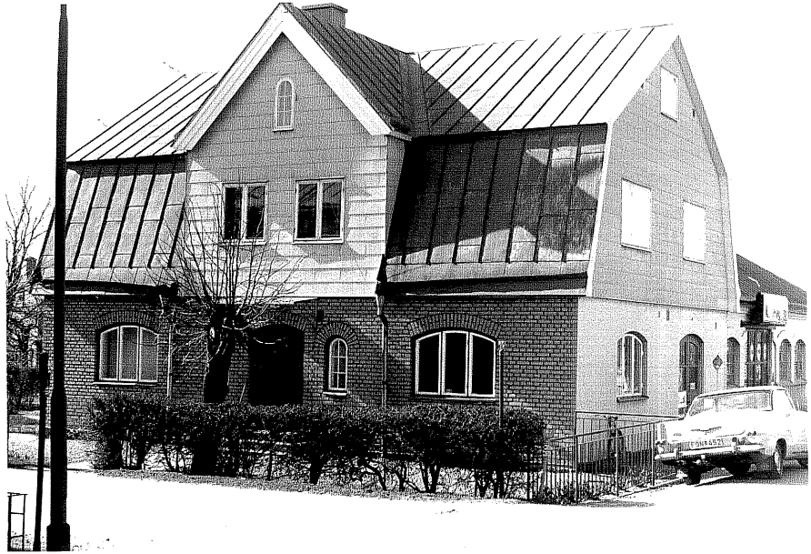
Bostadshus och bilverkstad a fr. SO,3:18.

Ödeshög sn Modellen 6 Kvarngatan foto:M.Wikdahl,1978