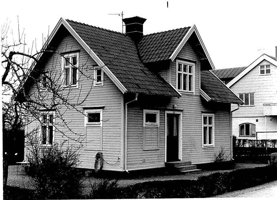
Bostadshus a fr.SV,16:25.