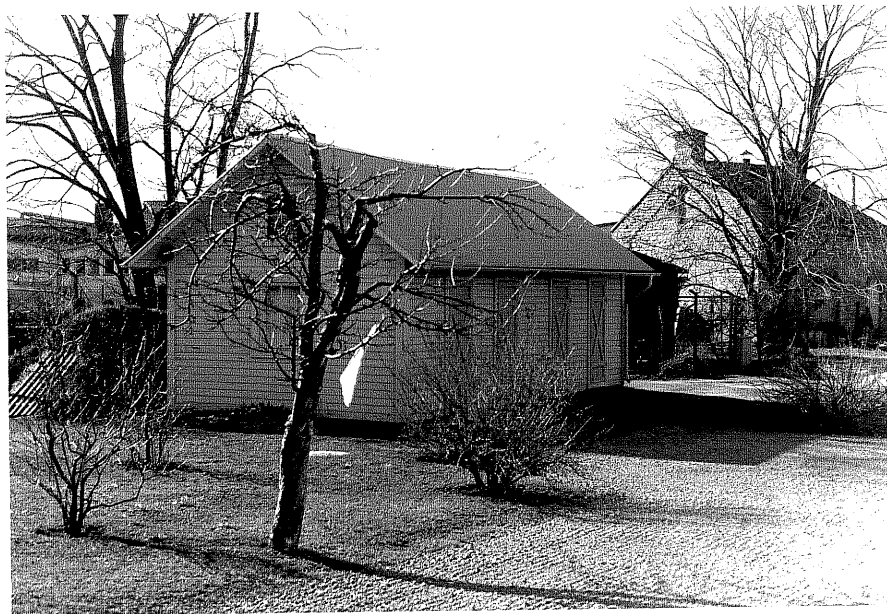
Uthus b fr. 50,3:20.