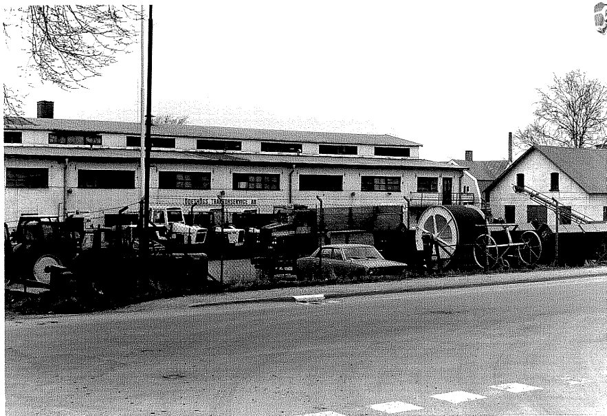
Fabriksbyggnad fr. S,3:35.

Ödeshög sn Modellen 8 Kungsvägen foto:M.Wikdahl,1978