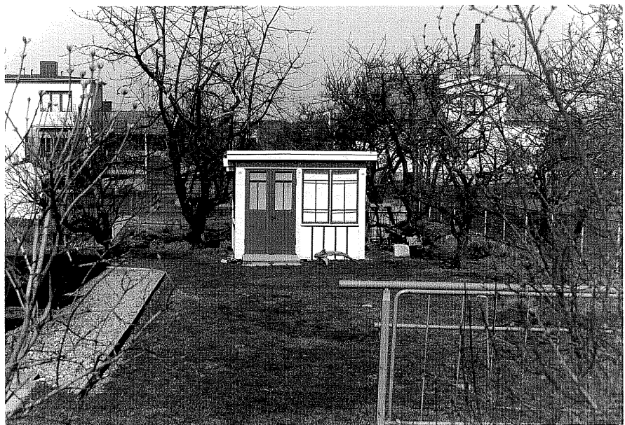
Uthus b fr.S,3:2.