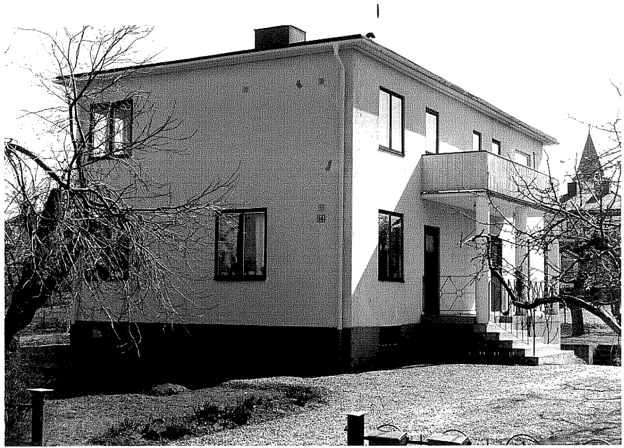
Bostadshus fr. NV, 3:5.

Ödesög en Montären 3 Bryggarevägen 14 foto:M.Wikdahl,1978