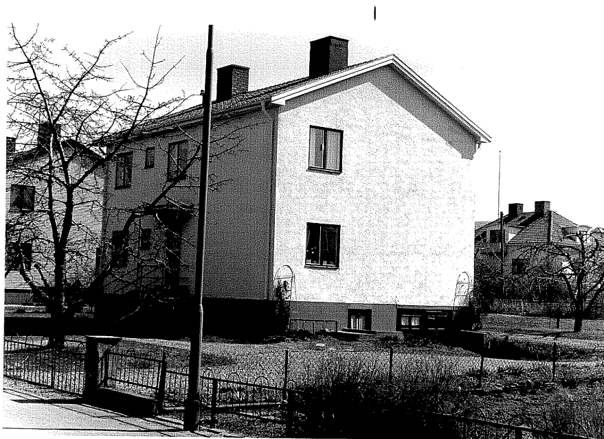
Bostadshus fr. NV.,3:6.

Ödeshög sn Montören 4 Bryggarevägen 16 foto:M.Wikdahl,1978