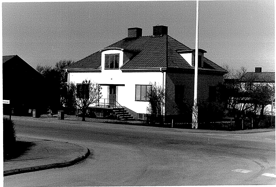
Bostadshus fr. 90,2:32.