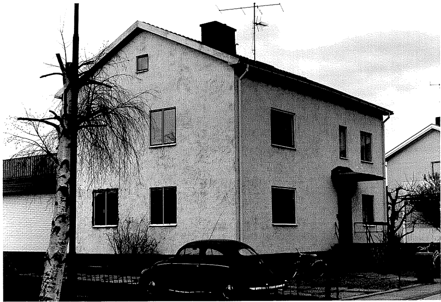
Bostadshus fr.SV, 8:22.

Ödeshög sn Bautastenen 11 Klockarvägen 5