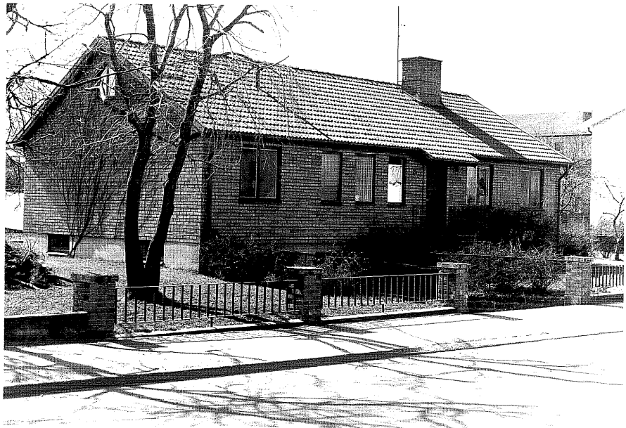
Bostadshus fr. N,2:30.

Üdeshög sn Mursleven 4 Kungsvägen 25