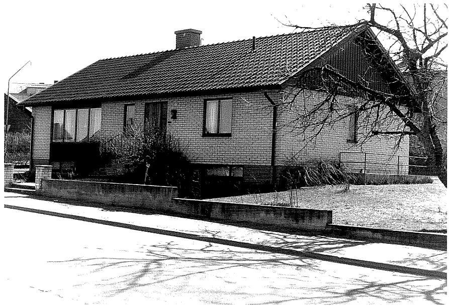
Bostadshus fr. V,2:31.