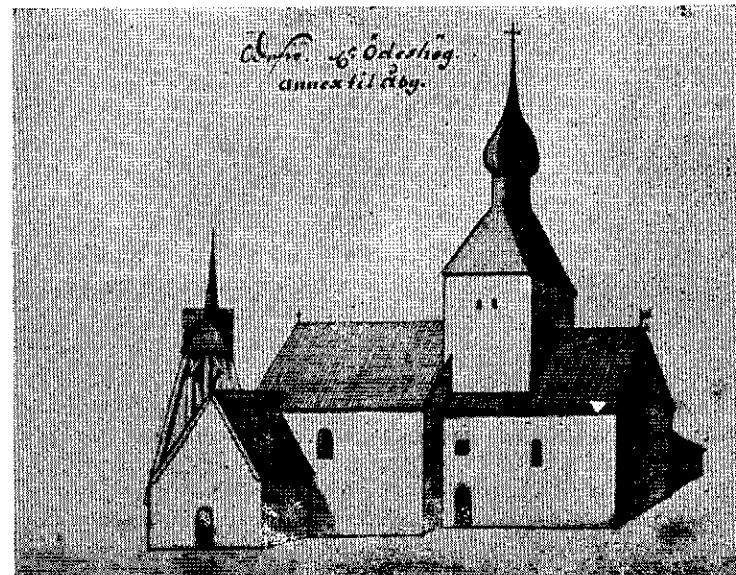
Danskarna slog läger vid Ödeshögs kyrka. Bilden är från 1690-talet.

Fienden hade emellertid tagit till flykten, varför herr fältöversten gick i kvarter på samma plats inte långt ifrån en hög kyrka och lät den del av hären, som utgjort förtruppen, rycka in i läget.