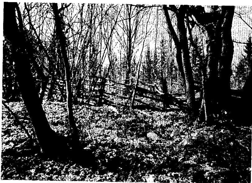
"Hästafällan" berättar också krigshistoria.