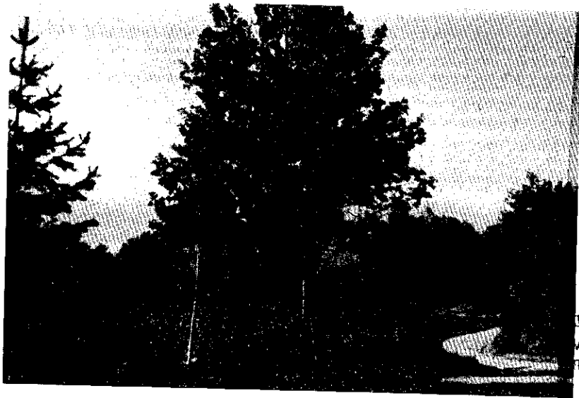
Fäktahål, ett minne från sjuårskriget.