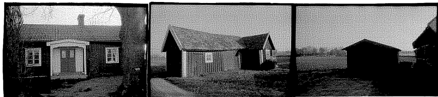
Foto II. Bostadshus från NV