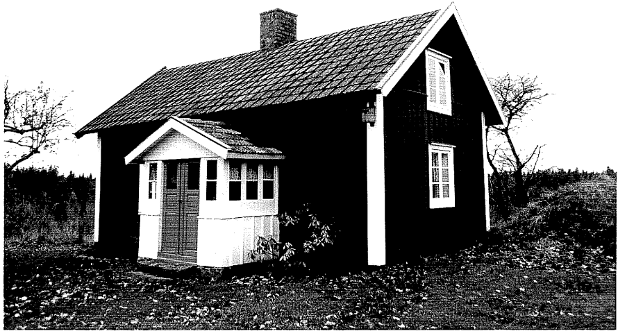
Neg. nr. T 06:26