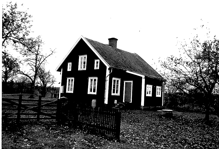
Neg. nr. T 06:23 Manbyggnaden från N0