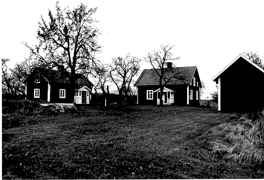
Neg. nr. T 06:24 Gårdsmiljön från S0

Ödeshög kommun Trehörna socken Nyarp 1:1 Nyarp