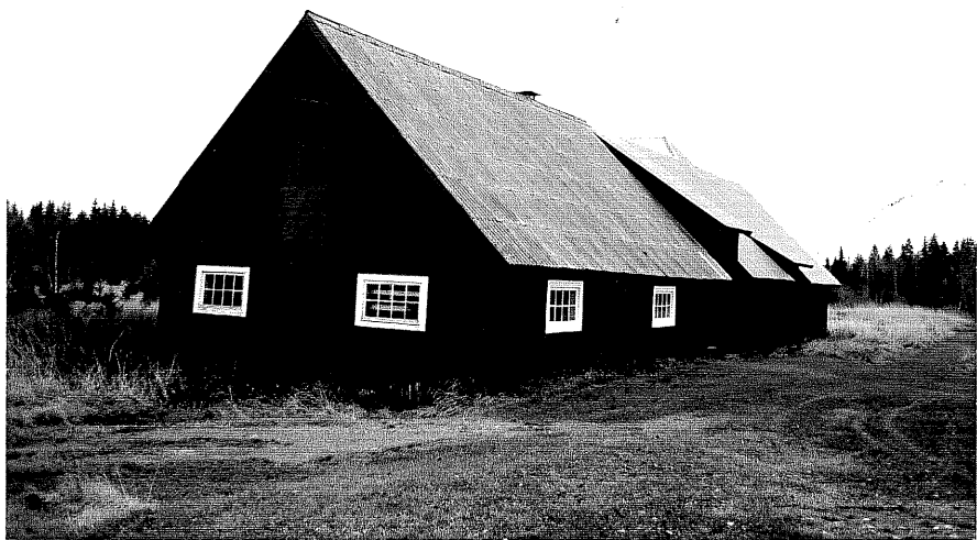
Neg. nr. T 06:25