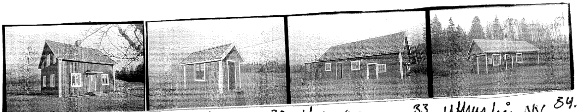
Bostadshus från SV 31 Bod från SO 32 Ladugård SV 33 Uthus från NV 34.