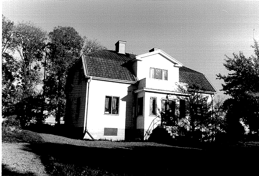
Neg nr ÖKM 11:22 Bostadshus från V byggnad a

Ödeshögs kommun V Tollstad socken Näfstad 3:3