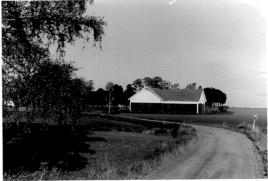
Neg nr ÖKM 11:27 Miljö från SV byggnad c

Ödeshögs kommun V Tollstad socken Näfstad 3:3