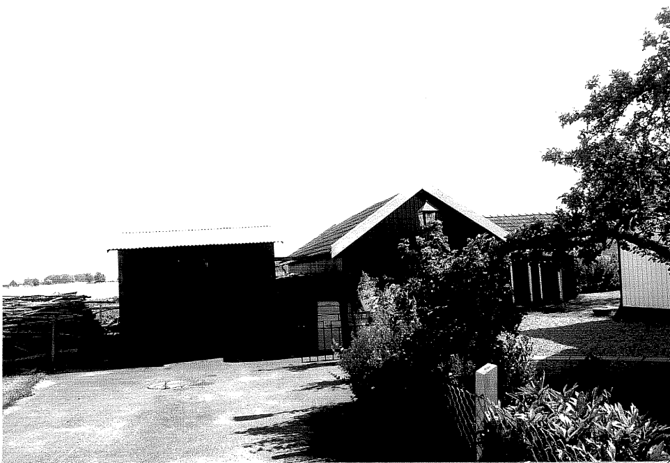
Neg. nr. V.T 06:11 Uthus och garage mot sydväst