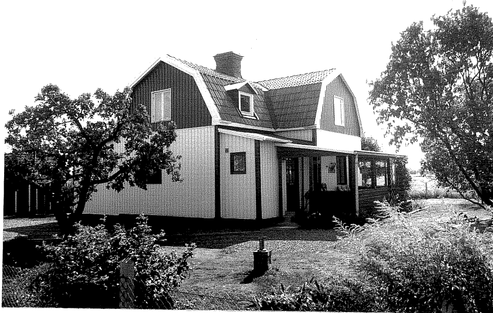
Neg. nr. V.T 06:10 Bostadshus mot väster

Ödeshögs kommun V:a Tollstad socken Näfstad Östergård 1 8 Hilltorp