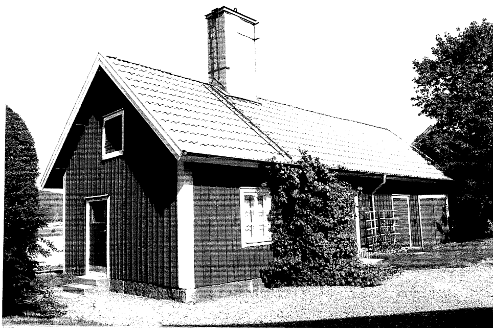
Neg. nr. V.T 06:21 Bod mot sydväst