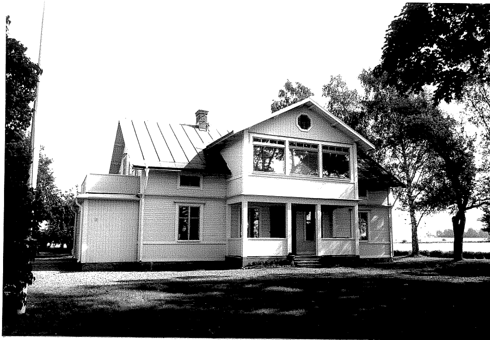
Neg. nr. V.T 06:20 Bostadshuset mot väster