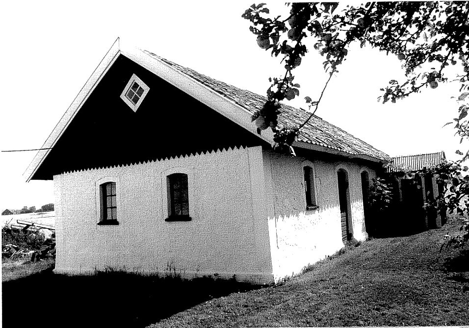
Neg. nr. V.T 06:23 Svinhus mot nordväst