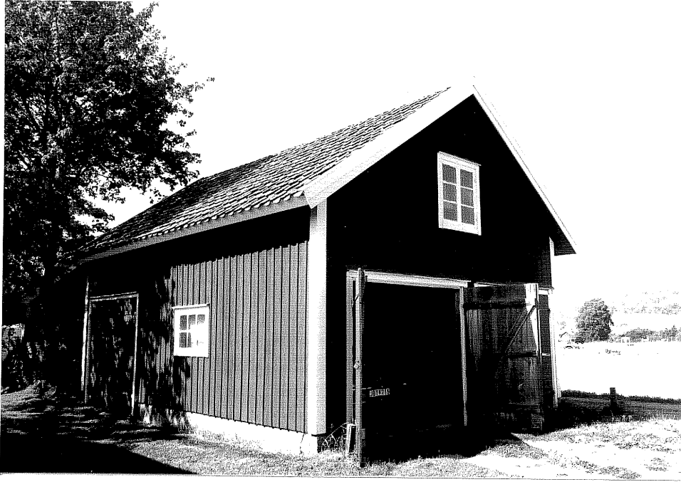
Neg. nr. V.T 06:22 Garage mot öster