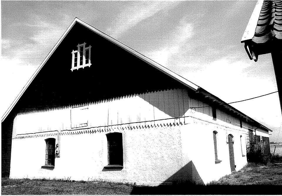
Neg. nr. V.T 06:24 Ladugård mot sydväst