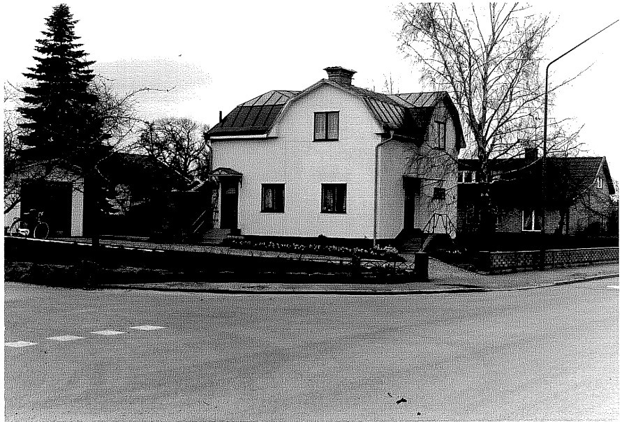
Bostadshus a fr.NO, 16:14.