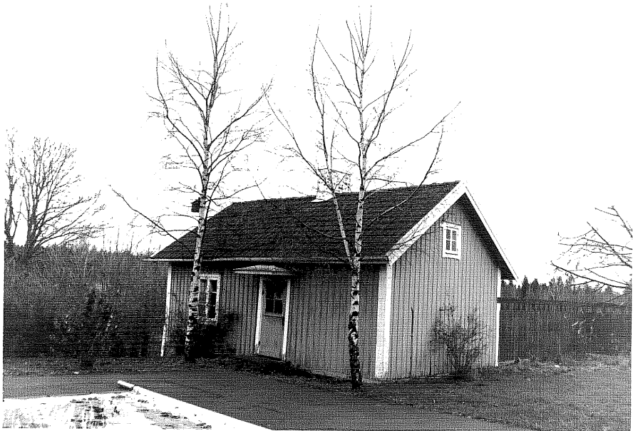
Neg. nr. T 14:17 Gäststuga från NO