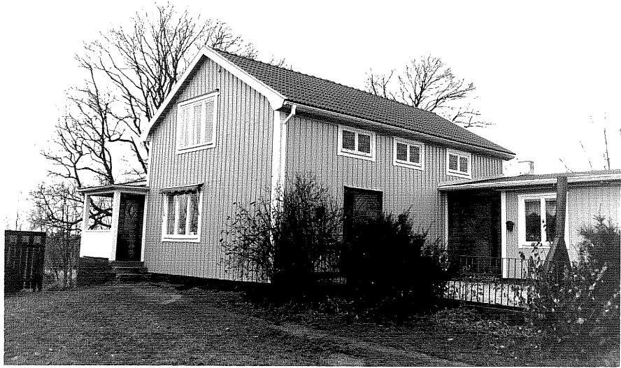
Neg. nr. T 14:16 Manbyggnaden från SV

Ödeshögs kommun Trehörna socken Olstorp 1:2 Olstorp