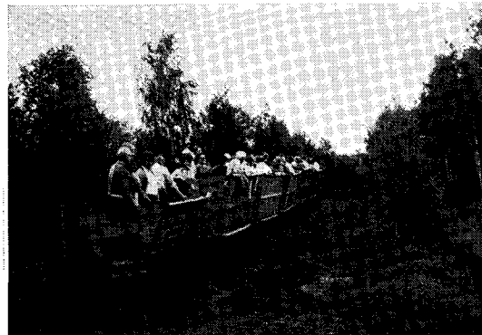
Exkursion på Dags mosse 1971, orånad av kulturnämnden. Utfärden företogs med vagnar på torvströfabrikens miniatyrjärnväg.