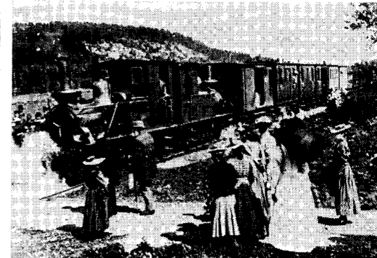
Vadstenatåget stannar vid Omberg en utflyktsdag vid sekelskiftet.