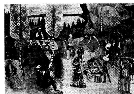
Pingstfest på Omberg.

Midsommar dagen strömmade många tusen personer till Omberg, berättar Östgöta-Bladet. "Kl. half 1 beträddes den med blågul duk prydda talarestolen af dagens hufvudtalare, skriftställaren Verner von Heiden-