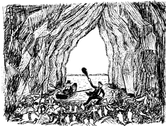
Här ovan klockaren slåss med trollen i Rödgavel. T. h. drottning Omma väntar på friaren.