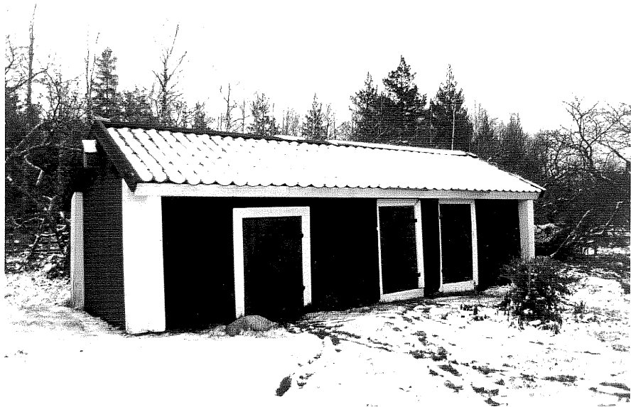
Neg. nr. T 10:29 Uthus från NV