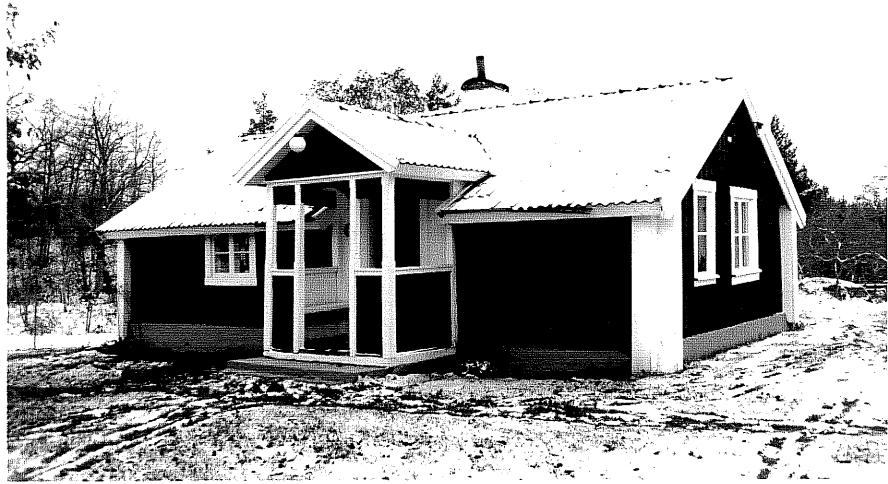
Neg. nr. T 10:30 Pukastugan från NO

Ödeshögs kommun Trehörna socken Pukeryd 1:1 Pukastugan