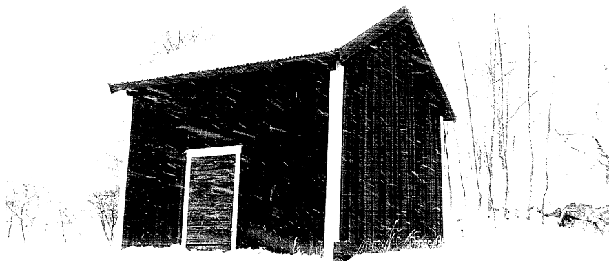
Neg. nr. T 12:25 Uthus från SO