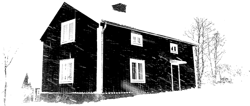
Neg. nr. T 12:24 Bostadshuset från SO

Ödeshögs kommun Trehörna socken Pukeryd 1:2