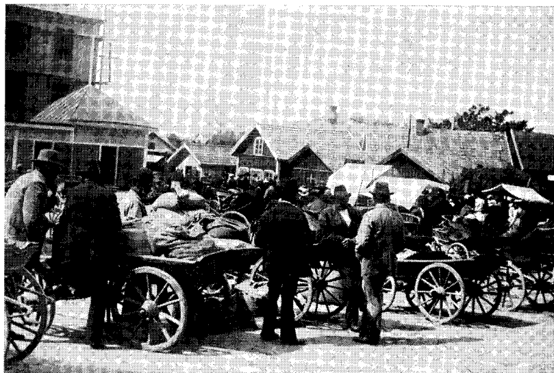
Den livfulla torgbilden från Ödeshög torde härstamma från sekelskiftet.