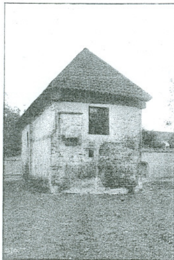
Märten Skinnarens hus, Vadstena.

Se ut över sjön! Den härligaste, kanske, norr om Alperna. Där blir snart en strandpromenad. Se också till höger, uppåt Murgatan, gamla klostermuren!