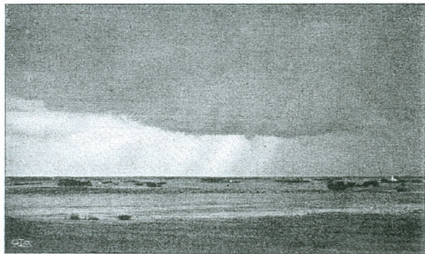
Åskväder över slätten vid Alvastra.

Ödeshögs kyrkby ligger 16 km från Smålandsgränsen och 29 km N om Gränna, vid ett landsvägskors, där Linköpings- och Örebro-landsvägarna förena sig för att genomgå Holaveden, den fordom väldiga skogstrakt, som börjar strax S härom.