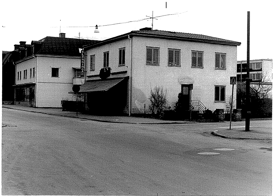
Affärs och bostadshus a fr. V, 2:5

Ödeshög sn Riddaren 5 Riddargatan 7 foto:M.Wikdahl,1978