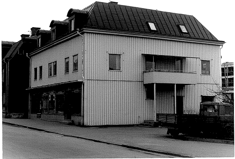
Affärs och bostadshus fr.V, 2:4