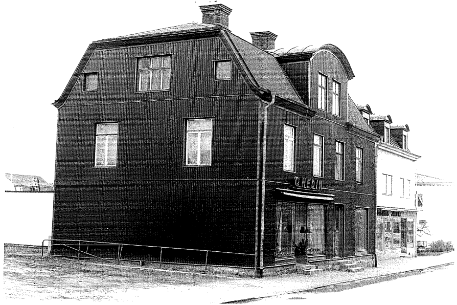
Affärs och bostadshus fr.N, 2:3

Ödeshög sn Riddaren 7 Riddargatan 3 1978