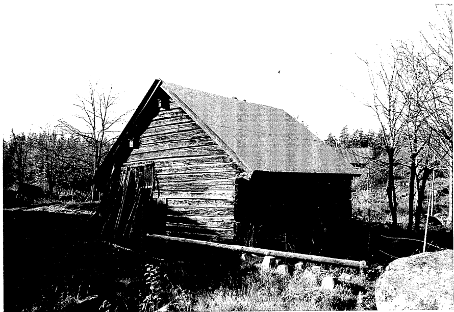
Neg. nr. T 05:12 Lada från SO