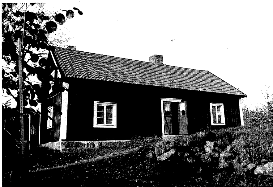
Neg. nr. T 04:37 Bertilstugan från S