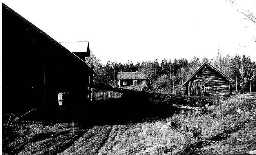
Neg. nr. T 05:02 Miljö från SO

Ödeshög kommun Trehörna socken Bertilstugan 1:1 Bertilstugan