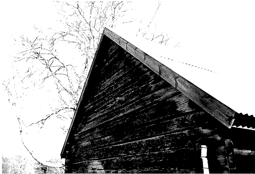
Neg. nr. T 05:14 Detalj av ladans norrvägg