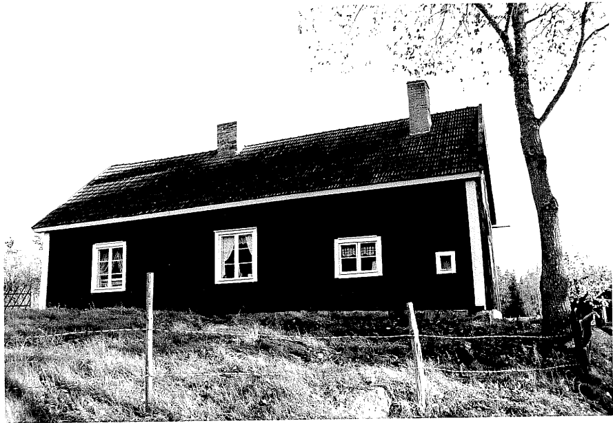
Neg. nr. T 05:15 Bertilstugan från NV