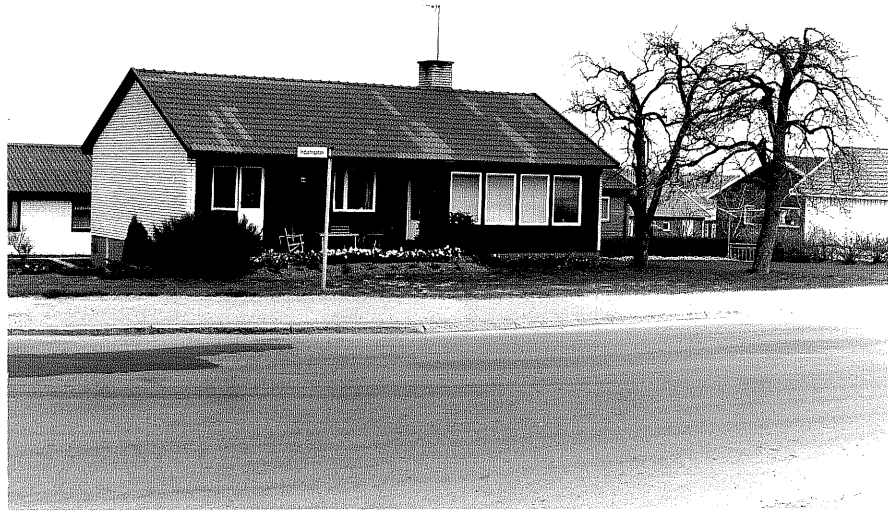
Bostadshus fr.S, 16:7.