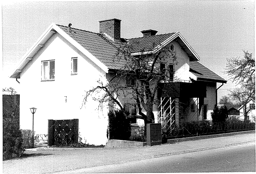
Bostadshus a fr.50, 12:10.

Ödeshög sn Rosen 5 Storgatan 42 1978.